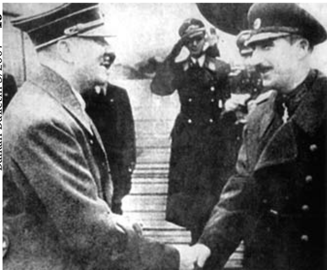
Hitler en Tsaar Boris

In die tijd was de Bulgaarse regering pro-Duits; koning Boris III von Saxe-Coburg Gotha was geboren in Duitsland. Boris was beslist niet anti-joods. Maar hij wilde - koste wat het kost! - het oorlogsgeweld buiten de Bulgaarse grenzen houden. En Duitsland stond voor de grens. Dus sloot Bulgarije zich in maart 1941 aan bij de As-mogendheden.